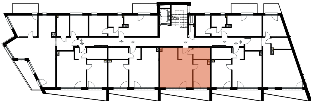
LOKAL M. 11